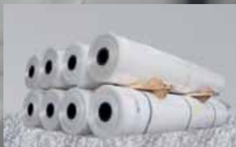
Bobine in polietilene.