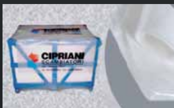
Cappucci in polietilene.

La nostra attività si propone come obiettivo principale la protezione dei Vostri articoli da ciò che li può danneggiare durante il trasporto o lo stoccaggio presso la Vostra sede.