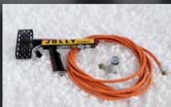
Termopistola Jolly Security.